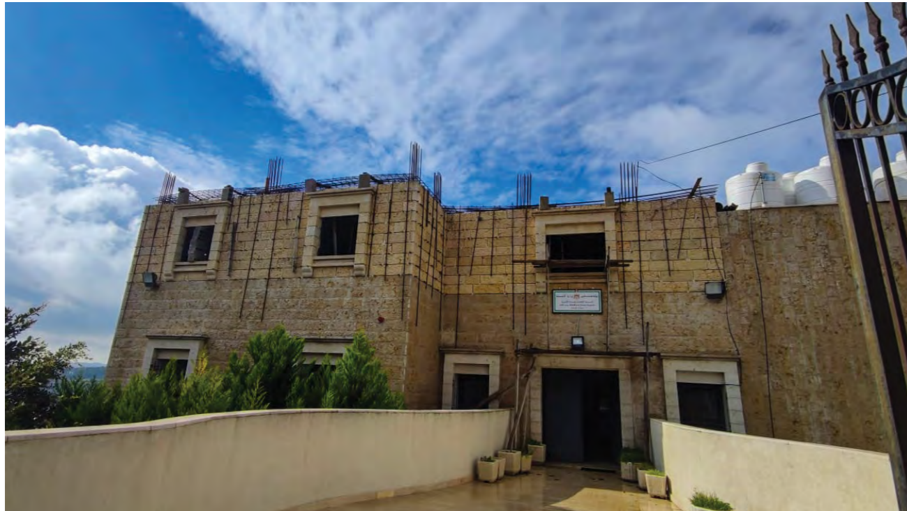
La clinique d'Al Walaja, avec des matériaux de construction toujours présents au deuxième étage, car les autorités israéliennes empêchent leur enlèvement après l'émission de l'ordre militaire d'arrêt des travaux.

Depuis le 7 octobre 2023, les forces armées israéliennes ont considérablement renforcé cette politique, en rompant les liens territoriaux entre les villes, les villages et les communautés 3 , et de ce fait, en perturbant les services de santé publique, les établissements scolaires, les moyens de subsistance, les relations sociales et l'accès humanitaire.