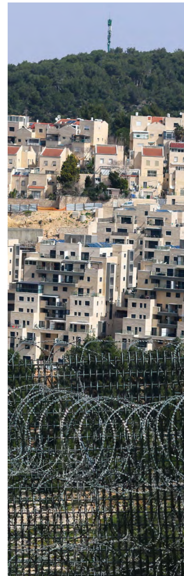
Vue de la colonie israélienne illégale de Gilo depuis l'intérieur d'Al Walaja, avec le mur militaire israélien entre les deux.

Le développement d'un deuxième étage avait pour objectif d'ajouter plus d'unités à la clinique, comme la médecine interne, une unité de lutte contre les infections, de soins pédiatriques et un laboratoire. La construction a débuté en 2020.