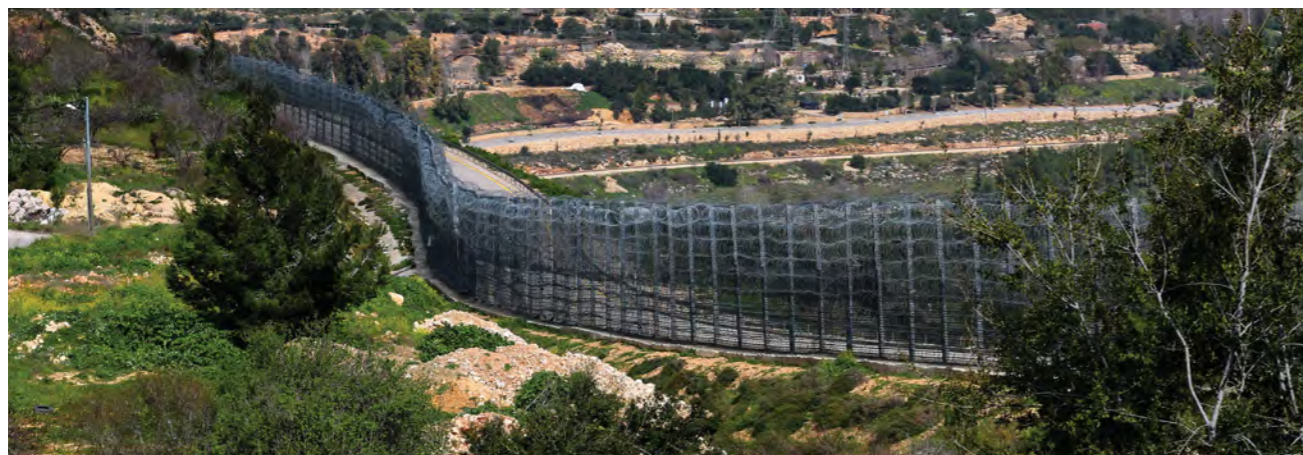
La route menant à Al Walaja depuis Bethléem. Le mur israélien longe la colonie israélienne illégale de Har Gilo. Le barrage routier militaire israélien se trouve juste après le rond-point, à côté de l'entrée de la colonie illégale (aucune image du barrage n'a pu être capturée pour des raisons de sécurité, car l'entrée de Har Gilo est constamment surveillée par des gardes colons). Ahmad Al Bazz / NRC, 2021)

Compte tenu du nombre de personnes atteintes de maladies chroniques à al-Walaja, il est également impératif d'installer un laboratoire dans la clinique. Au moins 28 habitants d'al-Walaja souffrent d'hypertension, de diabète ou de maladies thyroïdiennes ou ischémiques.