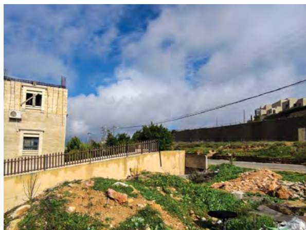
À droite de l'image se trouve la clinique d'Al Walaja, avec le mur israélien et la colonie israélienne illégale de Har Gilo de l'autre côté de la route, équipée de caméras faisant face au centre de santé. Le barrage routier militaire israélien est à quelques mètres seulement (Médecins du Monde Suisse, 2024)

Les restrictions d'accès aux services de santé de base en dehors d'al-Walaja contraignent la population à adopter des mécanismes d'adaptation nocifs, notamment en reportant leur accès à des soins de santé essentiel (voir page 15-16).