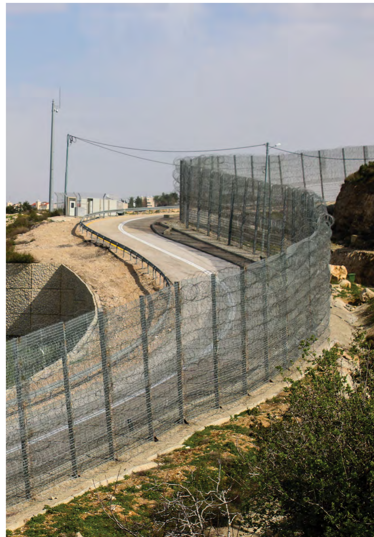
Le mur construit par Israël au début des années 2000, séparant le village d'Al Walaja de son environnement immédiat. Il comporte à la fois des portions en béton et en fil barbelé, avec une route militaire encerclant son périmètre pour le déplacement de l'armée israélienne.