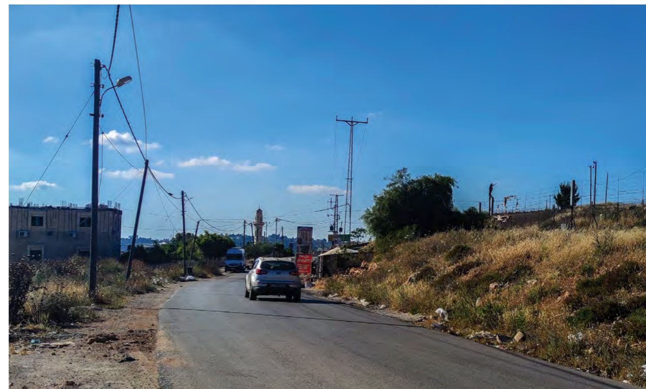
À droite de l'image se trouve la clinique d'Al Walaja, avec le mur israélien et la colonie israélienne illégale de Har Gilo de l'autre côté de la route, équipée de caméras faisant face au centre de santé. Le barrage routier militaire israélien est à quelques mètres seulement. (Médecins du Monde Suisse, 2024)

MdM opère à al-Walaja depuis 2018. MdM travaille en étroite collaboration avec la clinique d'al-Walaja et ses professionnels de santé, en soutenant l'intégration de la santé mentale dans les soins de santé primaires via le financement et le développement d'une unité de santé mentale et soutien psychosocial (SMSPS) dans la clinique. MdM fournit également des services d'urgence de SMSPS aux habitants d'al-Walaja touchés par des incidents liés à l'occupation tels que la démolition de leur domicile et la violence exercée par les colons.