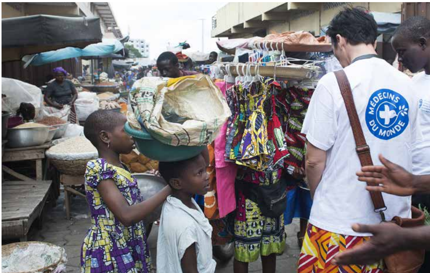
Le marché de Dantokpa à Cotonou, une place économique incontournable et lieu où les violences basées sur le genre sont omniprésentes.