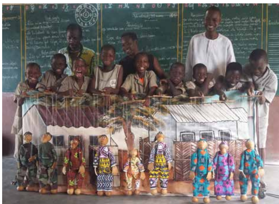
Atelier et répétition dans les écoles primaires de Toyoyomé et Djidjié, Cotonou.