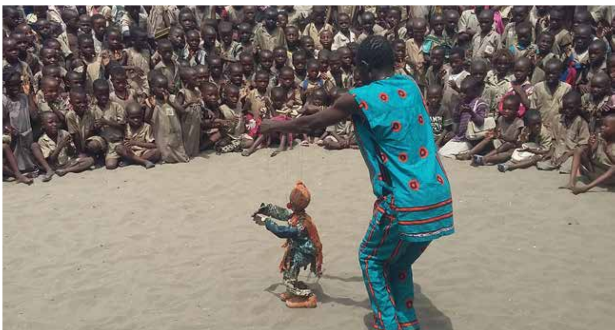
Spectacle proposé par le maître marionnettiste aux enfants de l'école publique.

Sur une durée de trois mois, les premiers résultats de ces ateliers sont prometteurs. Sur 80 élèves qui ont fréquenté les ateliers de marionnettes, 70% ont acquis une bonne