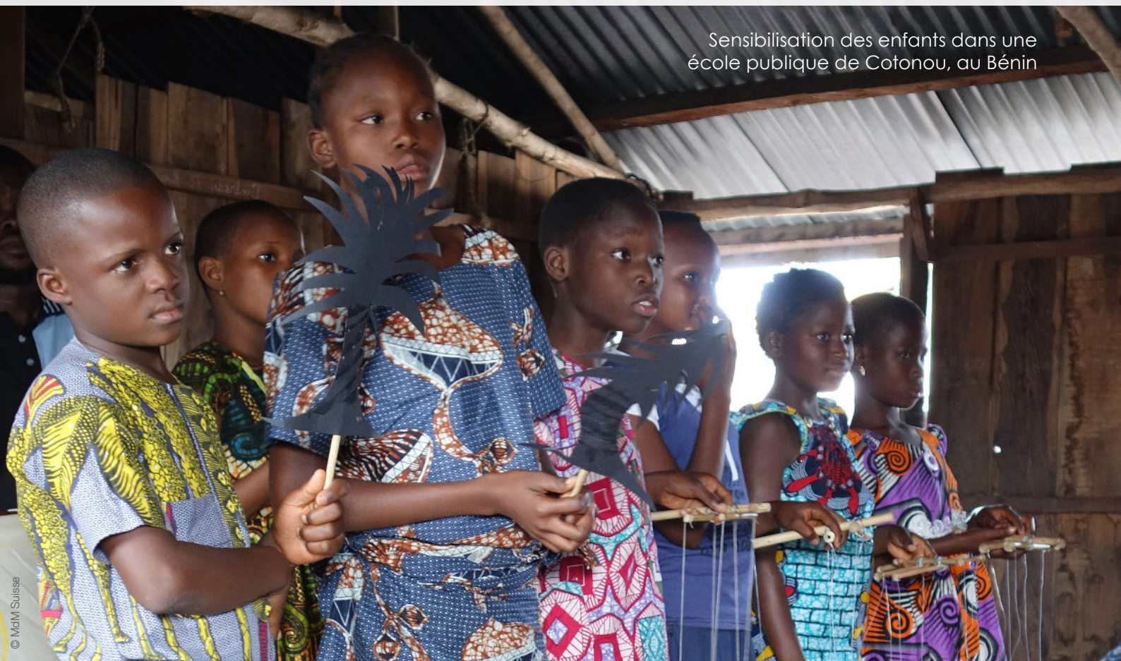
Sensibilisation des enfants dans une école publique de Cotonou, au Bénin

À l'occasion des 30 ans de la Convention des droits de l'enfant, Médecins du Monde met en avant son engagement pour protéger les enfants, prévenir les violences et prendre en charge les jeunes victimes.