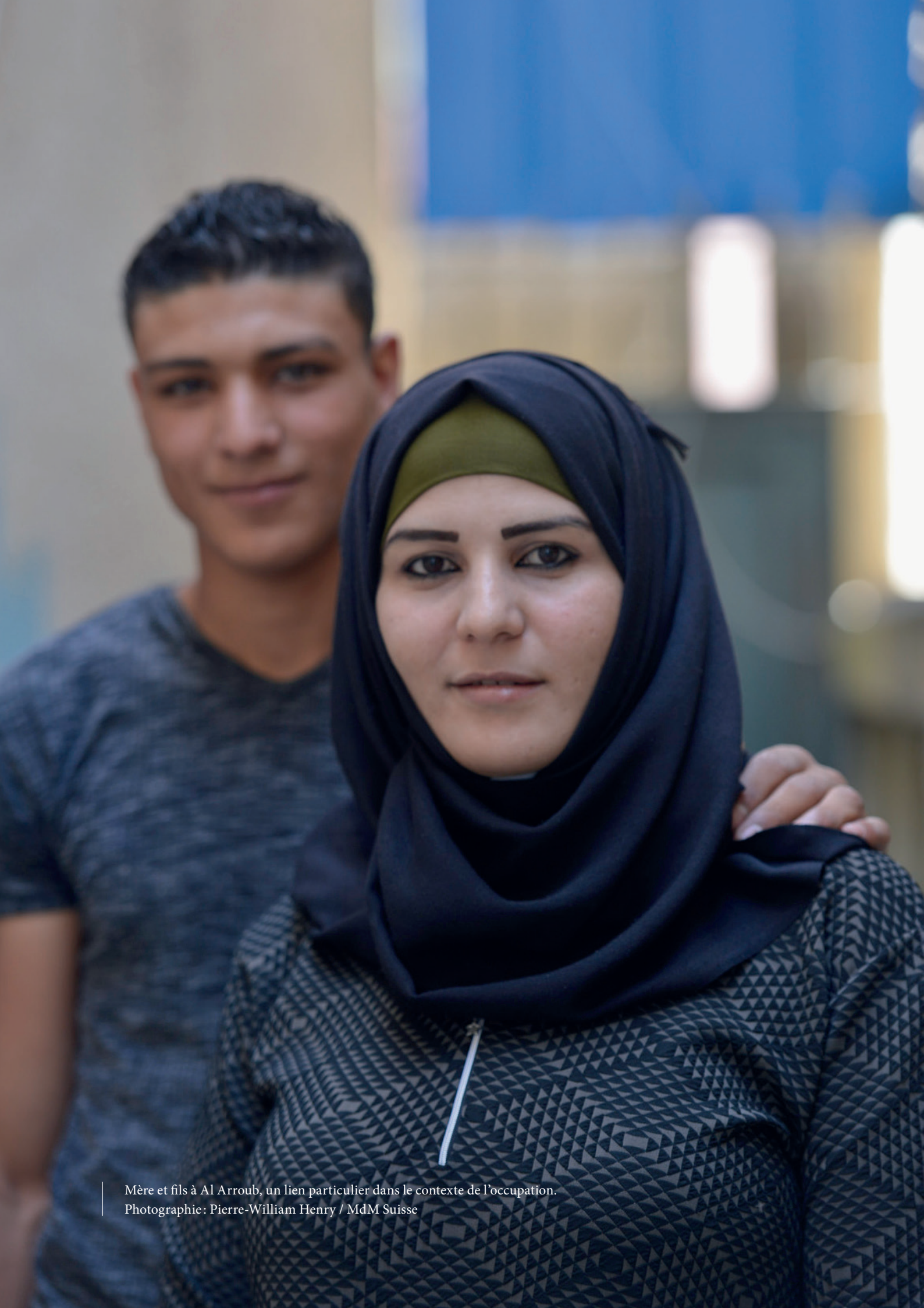
Mère et fils à Al Arroub, un lien particulier dans le contexte de l'occupation.